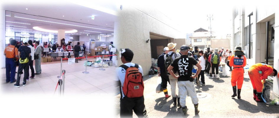
各地での災害ボランティアセンターの様子

内容 大規模災害時、復興支援の拠点となる災害ボランティアセンターについて 模擬会場を設置、その仕組みや活動の流れなどについて学びます。